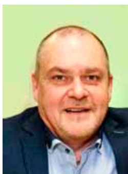
Ľuboš Čajník poslanec