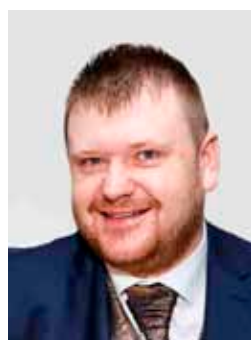
Roman Kuffa poslanec